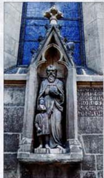
Die Skulptur des Bildhauers Karl Wolter von 1914 stellt den Nikolaus als Helfer eines notleidenden Kindes dar.

Der königlichen Regierung in Stuttgart war die konfessionelle Gleichheit in ihrem mächtig gewachsenen und Protestanten und Katholiken gleichermaßen umfassenden Staate ein besonderes Anliegen.