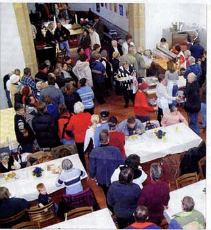
Seit 1998 verwandelt sich die Nikolaikirche alljährlich zur „Vesperkirche“, in der Bedürftige im Winter ein warmes Essen bekommen.

Mit einer Ausstellung in den Vitrinen vor seinen Diensträumen erinnert das Stadtarchiv an das 650-jährige Kirchenjubiläum. Unter den Dokumenten befindet sich eine Pergamenturkunde von 1387, die den ältesten schriftlichen Beleg für die „Sant Nyclus Capelle ze Rutlingen“ in den Beständen des Stadtarchivs darstellt. Zu sehen ist ferner die erste deutschsprachige Stadtchronik, die für 1531 vermeldet, dass Reutlinger Kirchengebäude, darunter die „St. Nicolaus Kirche“, ihrer Glocken beraubt wurden. Ausgestellt ist auch das Ratsdekret von 1726, das nach dem Stadtbrand einen Buß-, Bet- und Fasttag anordnete, an dem unter anderem „das heilige Abendmahl in der Nicola Cappel aufgespendet werden“ sollte. Eindrucklich ist schließlich eine Fotografie der Nachkriegszeit mit dem Torso von Kirchenchor und -schiff, dessen Wände mit Balken notdürftig gesichert werden mussten. Die Ausstellung ist zu den üblichen Rathauss-Öffnungszeiten bis Ende August zu sehen.