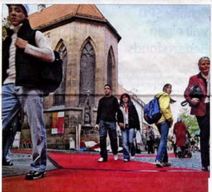
Immer wieder auch zentraler Veranstaltungsort, wie hier bei einer Aktion der Landeskirche 2005, als der rote Teppich für alle Gläubigen ausgelegt worden ist.

Die Nikolaikirche hat in Reutlingen in den vergangenen Jahrhunderten in kirchlicher Hinsicht eine oftmals untergeordnete, manchmal sogar vernachlässigte Rolle gespielt. Nichtsdestotrotz hat der gotische Sakralbau mit seiner markanten Architektur dem Stadtbild im Bereich der unteren Wilhelmstraße seit dem Spätmittelalter seinen unverwechselbaren Stempel aufgedrückt. Und er bot und bietet Raum für außergewöhnliche Nutzungen.